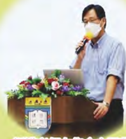
訓導老師在集會向同學推廣正向價值觀