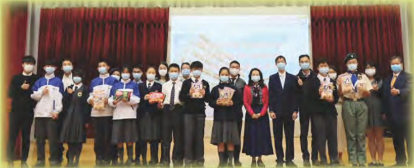
同學在「守時龍虎榜」奪取佳績，獲得學校嘉許

本組定期主持「國旗下的講話」，提升學生熱愛祖國的使命感和責任心，並以「提供優質教育，照顧全人發展」為目標，讓學校成為安全及富關愛的地方。