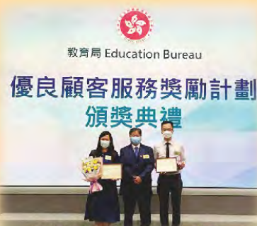
教育局 Education Bureau 優良顧客服務獎勵計劃 頒獎典禮