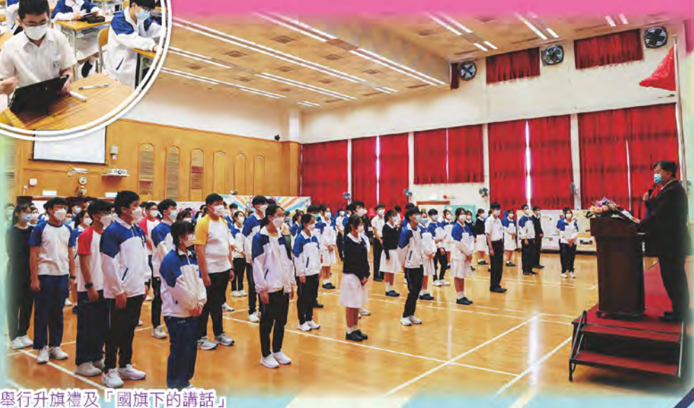
本校每星期舉行升旗禮及「國旗下的講話」