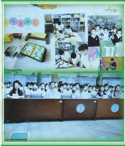
本校與內地姊妹學校進行線上交流

在疫情陰霾下，仍無阻兩地交流活動。本校透過網上視像直播系統，於2022年5月25日及27日分別與北京首都師範大學附屬中學第一分校及肇慶市地質中學進行真摯的交流。姊妹學校交流活動為兩地師生帶來全新的視藝學習體驗，交流活動由學生擔任主持、兩地視藝科老師分享視覺藝術科的教學課程和設計特色；兩地學生就不同的視藝作品交流設計概念和心得，分享非常精彩，大家聽得津津樂道，每一位學生都有所增益。是次活動既突破彼此的視野，也加強專業的交流與聯繫。相信在日後生活中，我們會用心追求美、實踐美、創造美。