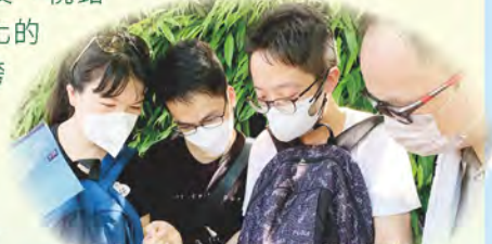
老師根據迪士尼的文化共融概念，設計「一堂好課」

2022年6月27日，本校安排全體教師參與「迪士尼教職員體驗日」，體驗「迪士尼青少年奇妙學習系列」活動。教師分為三組，參與不同的學習活動，包括：「迪士尼STEM體驗行」：參觀園區內的設施和親身體驗機動遊戲，認識承托力、微妙的身體比例、向心力、離心力及「視錯覺」；「迪士尼社會探索之旅」：了解全球化的影響、文化共融及地球村概念、感受人類跨越國籍、膚色、社會等種種差異，以及和諧共處的美好期盼；「迪士尼工作體驗坊」：感受自律及自我推動的力量、探索「迪士尼文化」、了解迪士尼的成功之道及良好工作態度的重要性。下午，各科組老師就地取材，以戶外學習為題，設計「一堂好課」。總括而言，本校教職員藉著是次教師專業發展日，走出校園，體驗一次既奇妙且充滿意義的教育之旅。