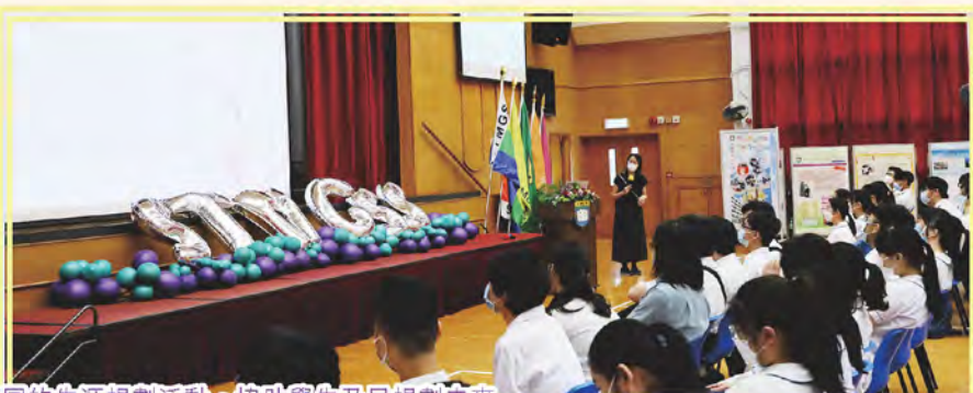
本校舉辦不同的生涯規劃活動，協助學生及早規劃未來