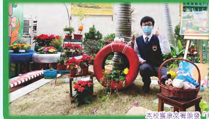
本校獲康文署頒發「綠化校園資助計劃」獎項