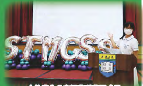
本校學生分享視藝科學習成果

在疫情陰霾下，仍無阻兩地交流活動。本校透過網上視像直播系統，於2022年5月25日及27日分別與北京首都師範大學附屬中學第一分校及肇慶市地質中學進行真摯的交流。姊妹學校交流活動為兩地師生帶來全新的視藝學習體驗，交流活動由學生擔任主持、兩地視藝科老師分享視覺藝術科的教學課程和設計特色；兩地學生就不同的視藝作品交流設計概念和心得，分享非常精彩，大家聽得津津樂道，每一位學生都有所增益。是次活動既突破彼此的視野，也加強專業的交流與聯繫。相信在日後生活中，我們會用心追求美、實踐美、創造美。