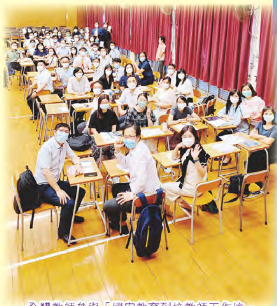
全體教師參與「國安教育到校教師工作坊」