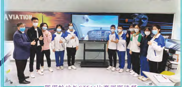
同學於校外STEM比賽屢獲殊榮