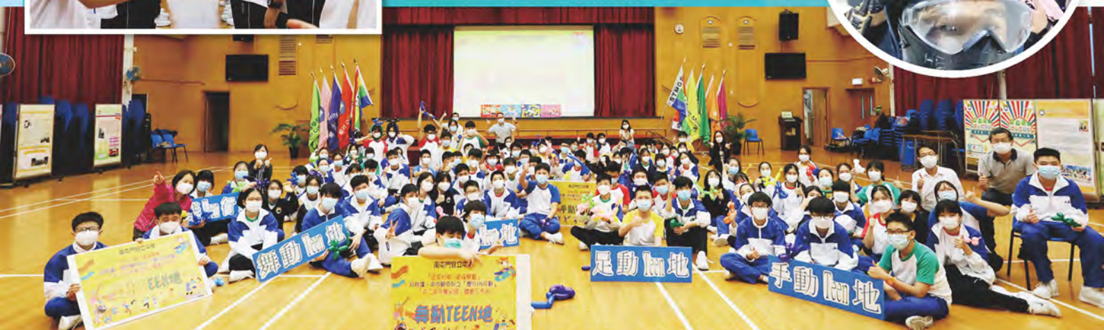
學生復課後積極參與「感恩珍惜·積極樂觀」同我講·陪你闖工作坊