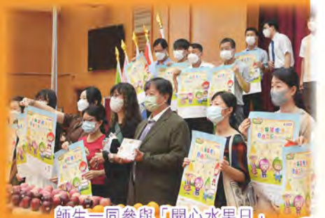
師生一同參與「開心水果日」